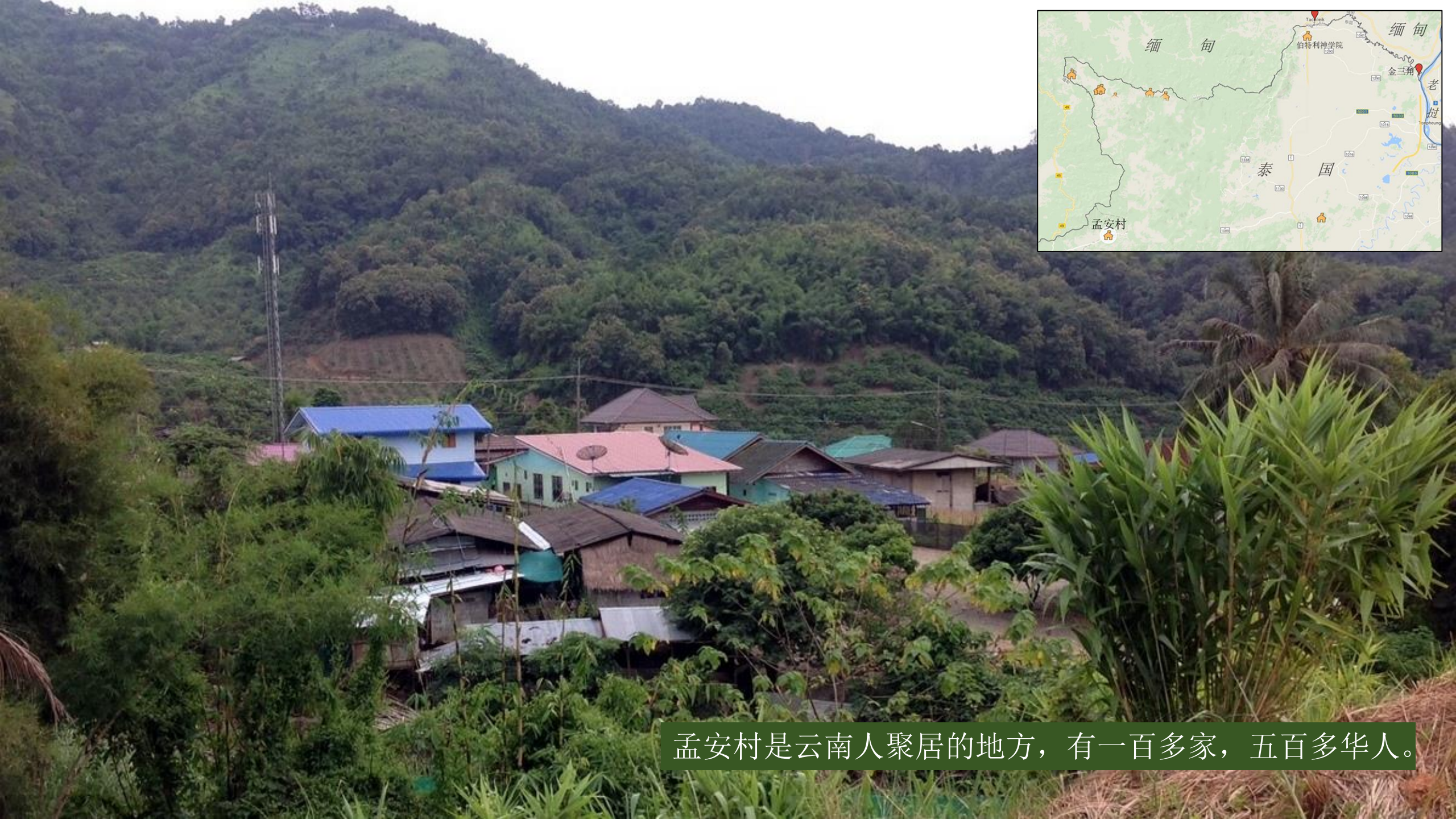
孟安村是云南人聚居的地方，有一百多家，五百多华人。