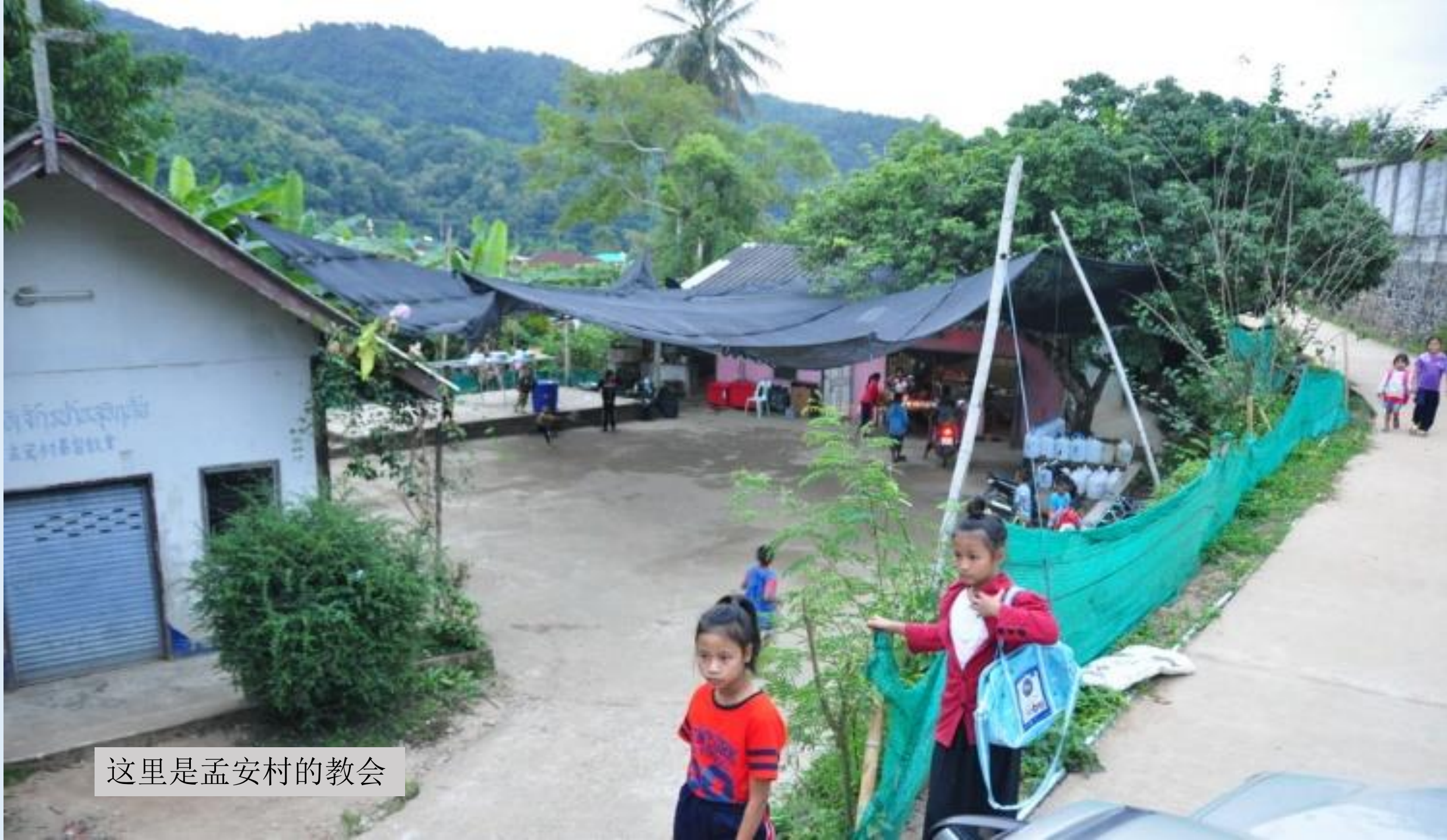
这里是孟安村的教会