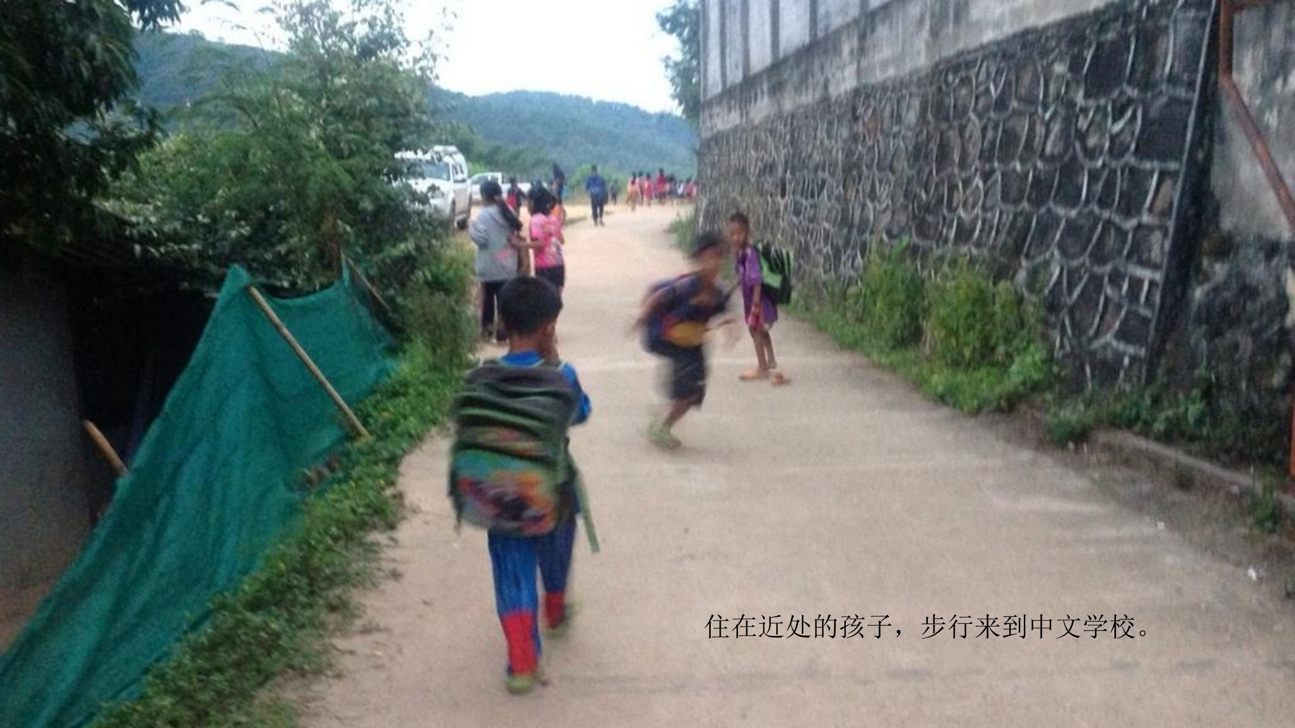
住在近处的孩子，步行来到中文学校。