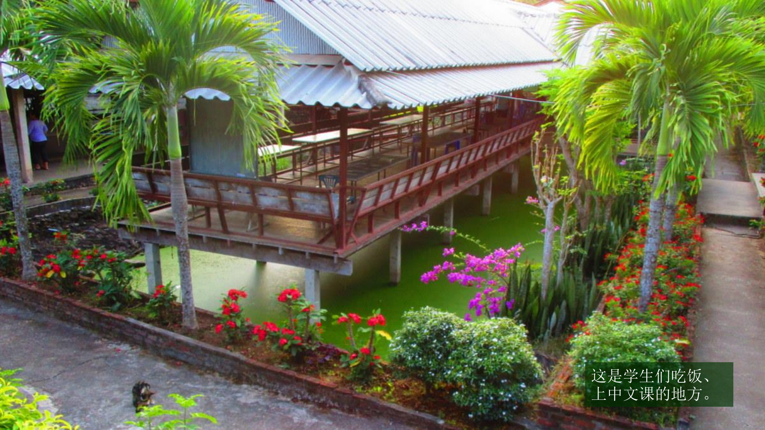
这是学生们吃饭、 上中文课的地方。