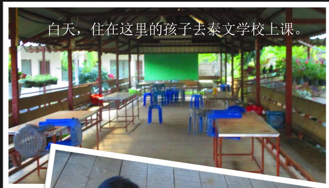
白天，住在这里的孩子去泰文学校上课。