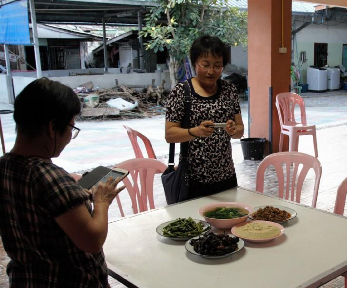
我们到的时候，四菜一汤已经摆在桌子上了。