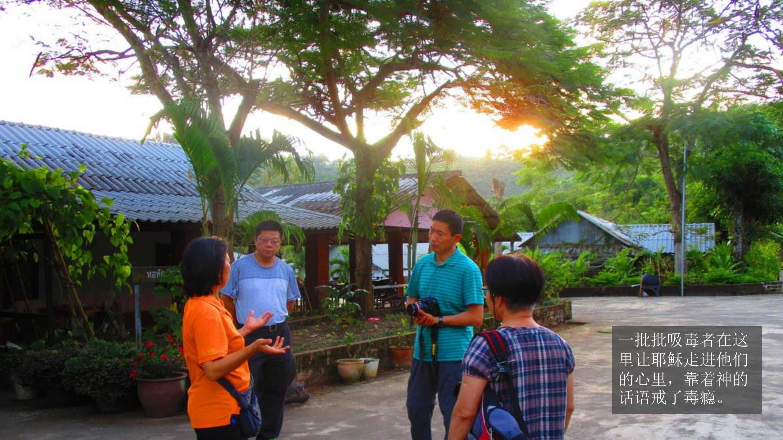
一批批吸毒者在这里让耶稣走进他们的心里，靠着神的话语戒了毒瘾。