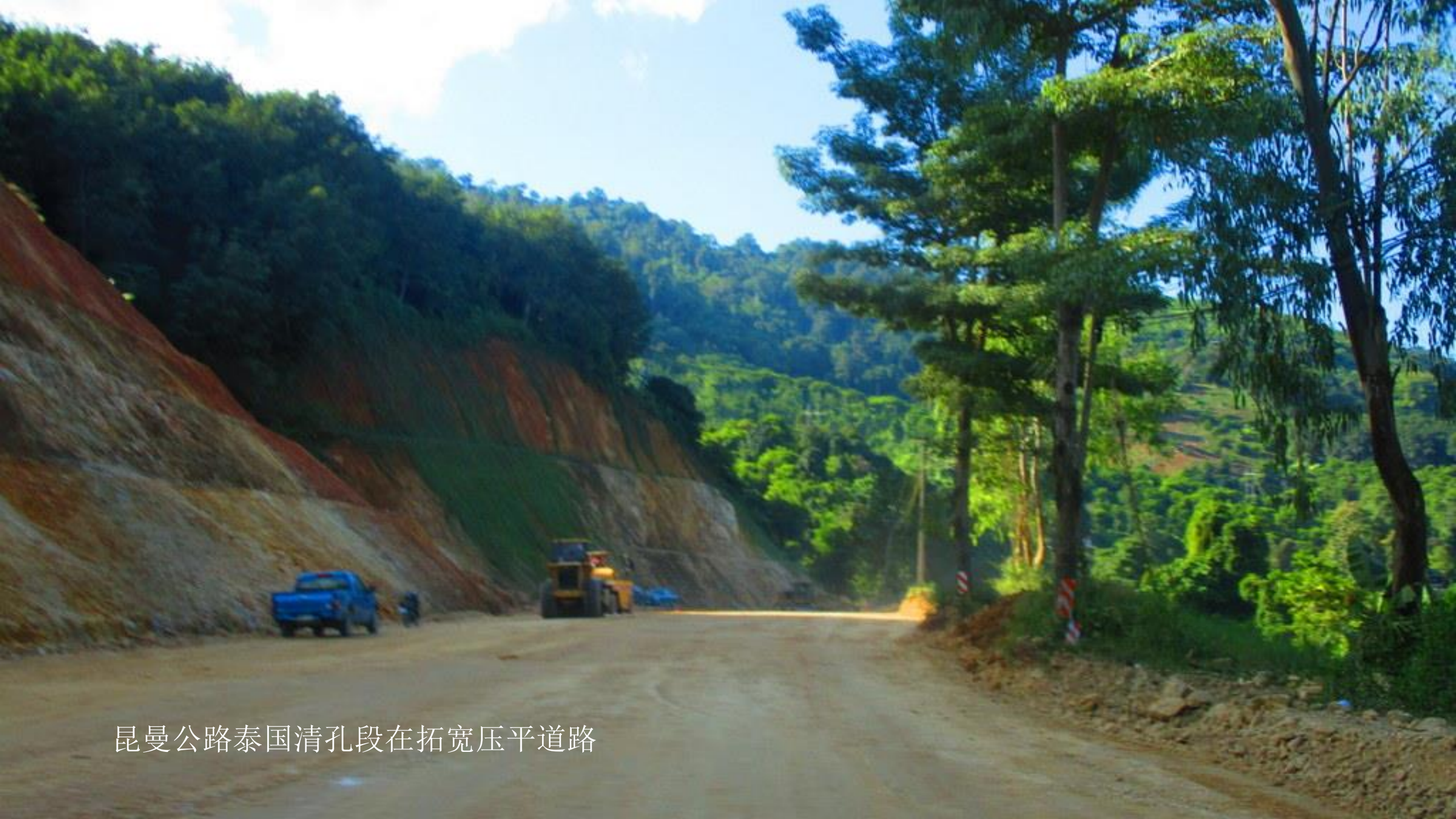
昆曼公路泰国清孔段在拓宽压平道路