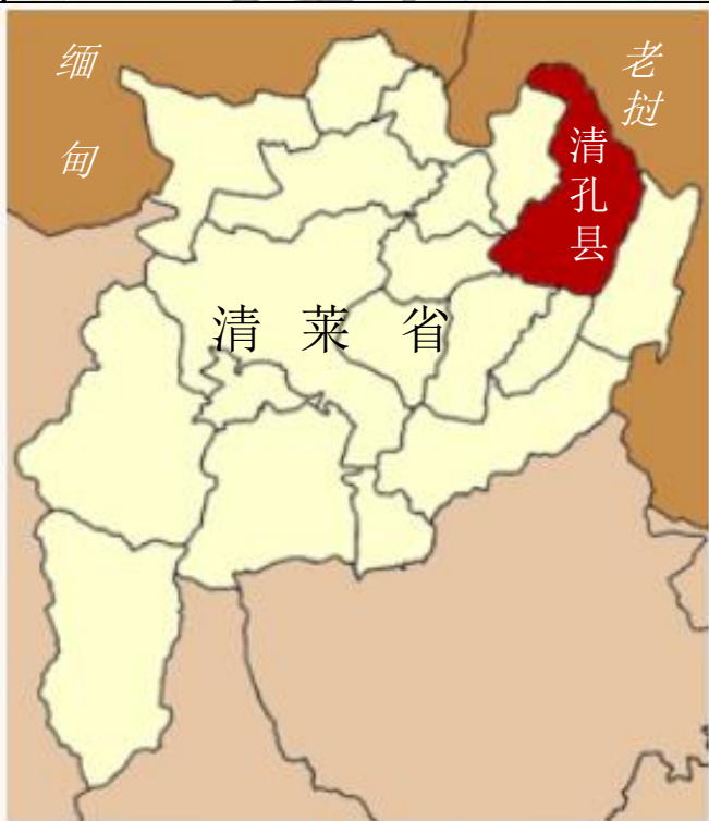
清孔县在清莱府的位置