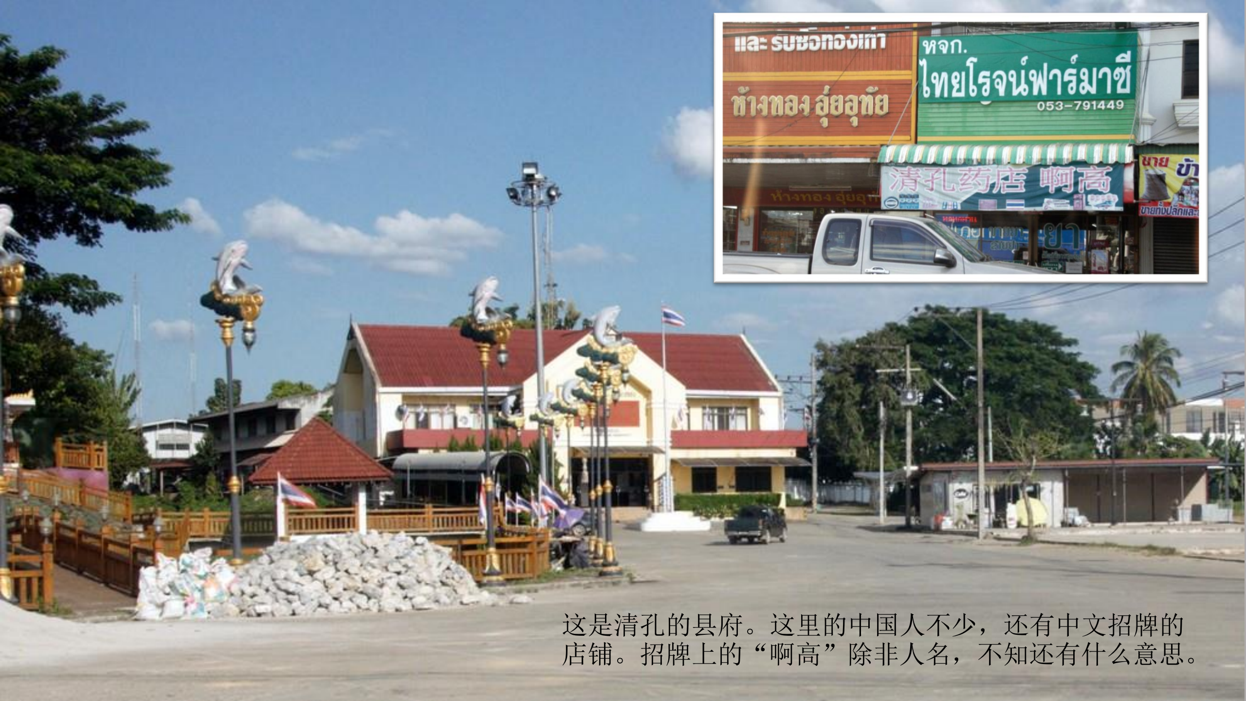
这是清孔的县府。这里的中国人不少，还有中文招牌的店铺。招牌上的“啊高”除非人名，不知还有什么意思。