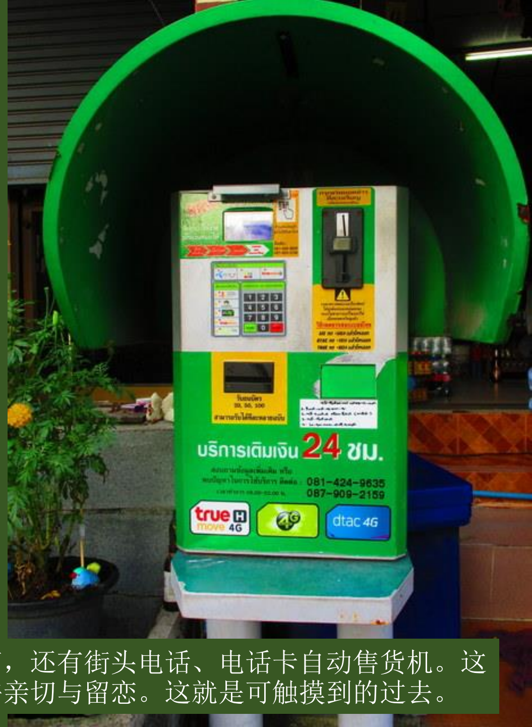
在旅馆旁边的街上走走。看见了邮筒，还有街头电话、电话卡自动售货机。这对从走得太快地方来的人，总有些许亲切与留恋。这就是可触摸到的过去。